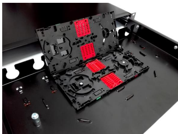
Szybki dostęp do kaset SCM-A