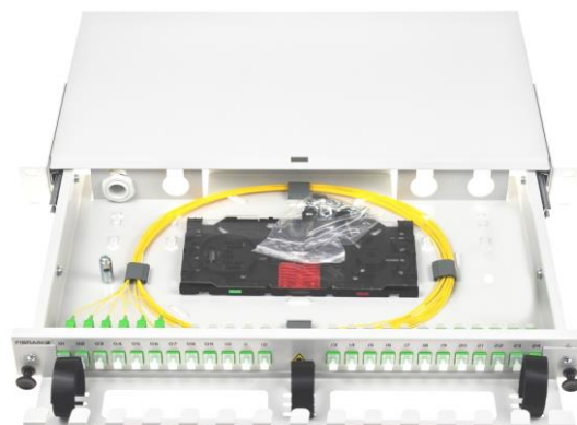
Przykładowo wyposażona przełącznica