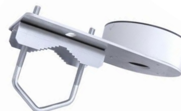
HIK134E + Z25DV75 + DS-1280ZJ-DM46