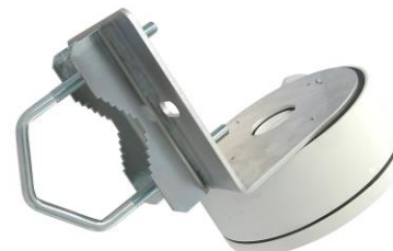
HIK134LE + Z25DV75 + DS-1280ZJ-DM18