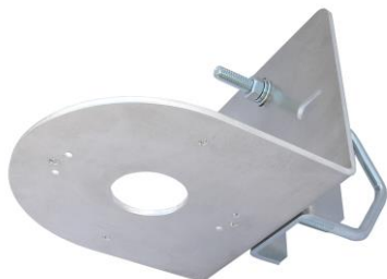
HIK134LE + Z25DV75

profesionálny držiak pre uchytenie kamier HIKVISION, DAHUA, TVT a iných značiek na trubku alebo stožiar vo vertikálnej alebo horizontálnej polohe