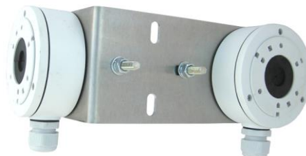
HIK100LE + Z75DV75 TWIN-C + 2x DS-1280ZJ-XS