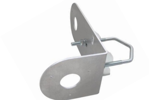
HIK100LE + Z75DV75 TWIN-C

profesionálny držiak pre uchytenie dvoch kamier HIKVISION, DAHUA, TVT a iných značiek na trubku alebo stožiar vo vertikálnej alebo horizontálnej polohe