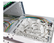
MDF 3U 288S SNP