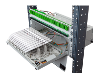
MDF 3U 288S SNP